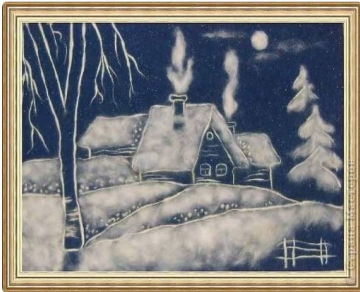
АПЛИКАЦИИ ИЗ ВАТЫ «ЗИМНИЙ ЛЕС» и «ЗАЙЧАТА В ЗИМНЕМ ЛЕСУ»