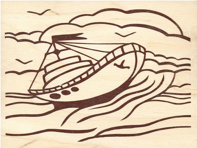
Аппликация по выжиганию